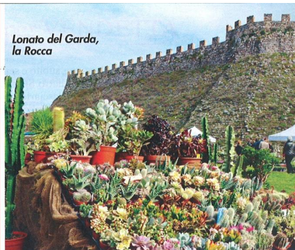
Lonato del Garda, la Rocca

alla fine del Settecento, con la mostra "L'immagine della città europea dal Rinascimento al Secolo dei Lumi". Per un soggiorno, da tener presente Stones of Venice , una nuova proposta di accoglienza e ospitalità in chiave contemporanea: un po' casa un po' albergo, a Piazza San Marco al Canal Grande, le residenze e hotel di charme Ca' Gottardi, Ca' Mariele, Ca' Delle Ortensie e Ca' Riva San Marco, tutte in posizioni strategiche, sono l'ideale per vivere a fondo la città, i suoi mercati, i bacari, le botteghe, con tutti i vantaggi e i comfort di un hotel vero. Info: tel. 0412759333, www.stonesofvenice.com