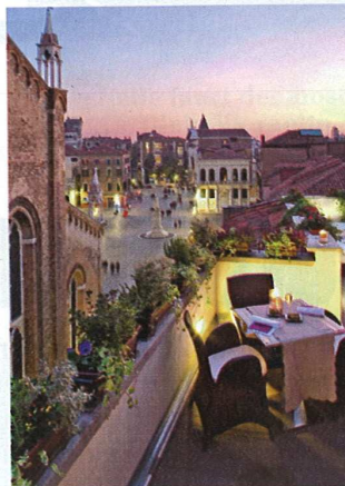
La vista dal Bloom.

La posizione è fantastica: a pochi passi da San Marco, ha una terrazza sulla piazzetta sottostante e interni eleganti e raffinati. Per Carnevale, 10 per cento di sconto per tre giorni (15 per cento dalla notte successiva) e una bottiglia di Prosecco in omaggio.